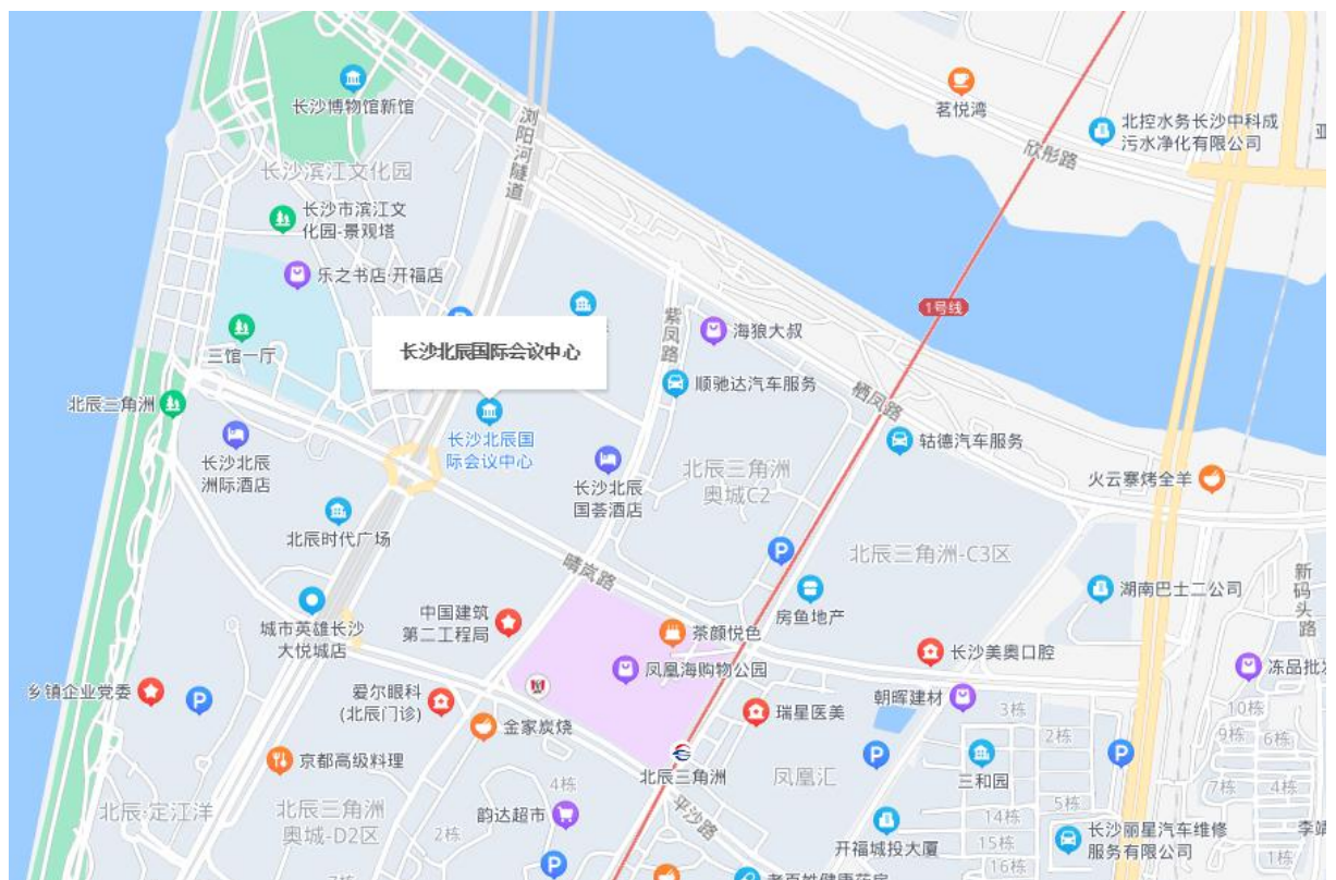
北辰国际会议中心地理位置示意图